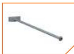
a331 Штанга BS-SH-1-30 Gray