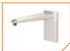
a333 Кронштейн BS-K-2 Gray